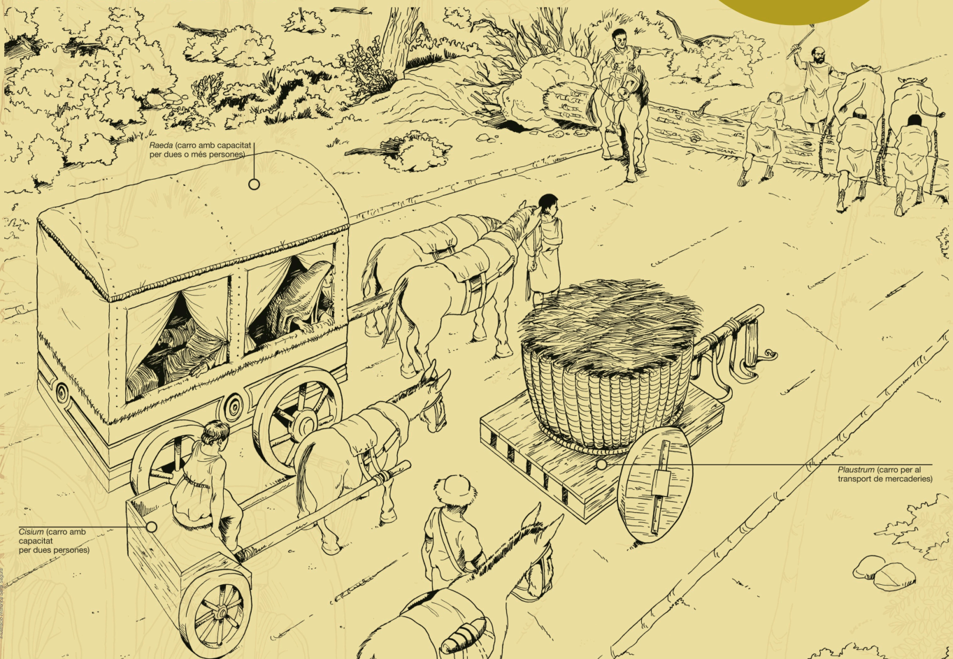
Raeda (carro amb capacitat per dues o més persones)