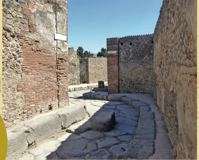
La ciutat romana de Pompeia

La ciutadania romana va passar de ser exclusiva dels homes lliures de Roma a primer als de la península Itàlica i després a la resta del territori romà. Donava dret a votar a les assemblees i fer carrera política.